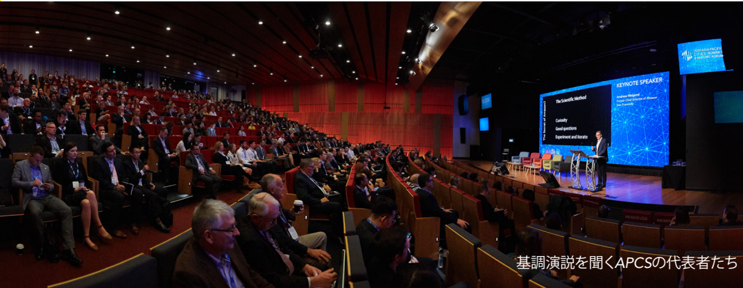
基調演説を聞くAPCSの代表者たち